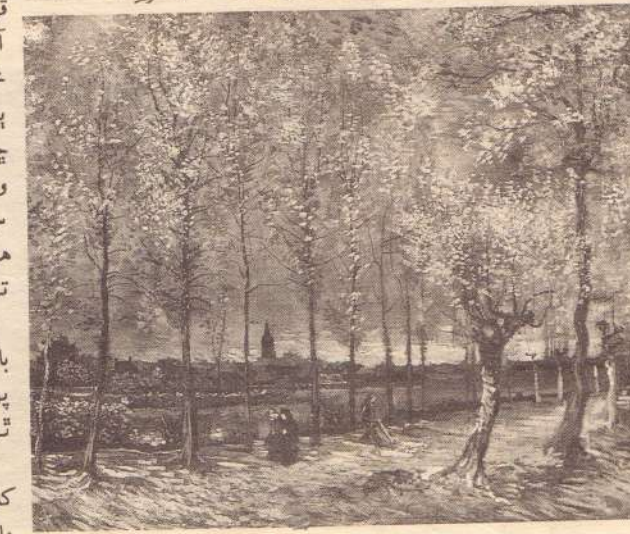
ونسٽ وان گو جون شاهڪار تصويرون

۾ ڏسجي ته ’سن فلاورز‘ جو خالق پاڻ انهن کي ڪهڙي حيثيت ڏئي ٿو: