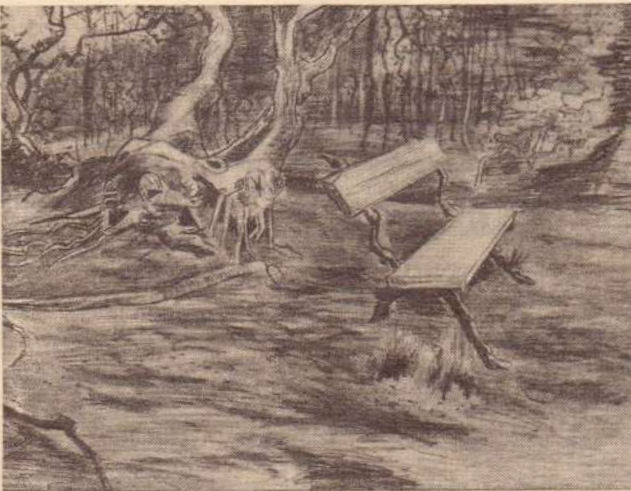
ونسنٽ وانگو جي شاهڪار تصوير

ديو کان پوءِ مون پڇيو، ”ڪي ڪٿي آهي؟“ ۽ گهر ۾ هر ڪنهن اهو سوال هڪ پئي کان پڇيو، ڪي ڪٿي آهي؟ آخرڪار چاچي جواب ڏنو ته ڪي گهر ۾ ناهي. ماني کان پوءِ چاچا ۽ چاچي مون کي اڪيلائي ۾ ويهاريو ۽ ڳالهائڻ شروع ڪيو. مان وري پڇيو: ”ڪي ڪٿي آهي؟“ تڏهن بهان ۽ ڪوڙ ٻڌي ونسنٽ پنهنجو هٿ ٻٽي جي شعلي تي جهليندي چيو: ”مون کي ايتري ديو ڏسڻ ڏيو، جيئن وقت مان باهه ۾ پنهنجو هٿ جهليان ٿو،“ سندس چاچي ست ڏني ٻٽي کي هيٺ ڪيرايو.