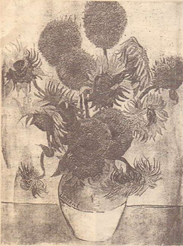
سن فلاورس جي پينٽنگ جيڪا ونسنٽ جي موت کان پوءِ 12 ملين ڊالر ۾ وڪروڻي.