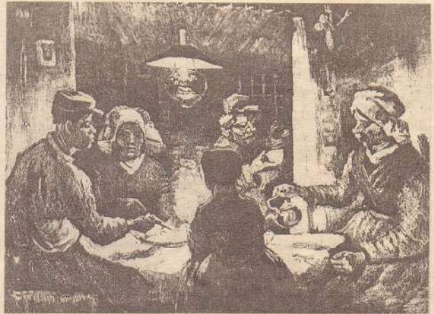
غربت جا ڪي منهن مهاندا ٻڌائين ٿا- ونسنٽ انهن کي چٽي امر ڪري چڏيو.

مان هڪ ٻج ڪري ويو آهي، جنهن جون پٽيون ڪري پيون آهن ۽ ٻي مڪڙي آهي، رائل بلورنگ جو پس منظر اٿس. ٽين تصوير ۾ پارهن گل ۽ مڪڙيون ٿڪي گلدان ۾ رکيل آهن، اها آخري تصوير سڀني کان وڌيڪ روشن آهي. اميد آهي ته سڀني کان بهتر ٿيندي ۽ مان سبجهان ٿو ته مان انهن تي بس نه ڪندس. هاڻي جڏهن ان ڳالهه جي اميد آهي ته ڳاڳين ۽ مان هڪ اسٽوڊيو ۾ رهون، تنهن ڪري مان اسٽوڊيو کي سينگارڻ گهران ٿو. ٻئي ڪنهن شيء سان نه پر وڏن سورج مڪي گلن سان..... جيڪڏهن منهنجو ارادو پورو ٿيو ته ڪل پارهن تصويرون ٺهنديون، جيڪي پيلي ۽ نيري رنگن جو هڪ سريلو راڳ هونديون. مان روزانو صبح جو سج اڀرڻ کان وٺي انهن تي ڪم پيو ٿو ڪيان، ڇو ته گل جلدي ڪوماڻجي ويندا آهن.“ *[ونسٽ جا خط اسان کي ان شاهڪار جي ابتدا مان به واقف ڪن ٿا ته اتنا مان به. اهي اسان کي سندن شه پارن جي تخليق جي هر مرحلي ۾ سوچ کان تڪميل تائين داستان ڏسين ٿا.] گل واقعي جلد ڪوماڻجي ويندا آهن. پر ونسنٽ وان گو جا ٺاهيل گل سؤ سال گذرڻ تي به نه ڪوماڻا، بلڪ انهن جي حسن جي تازگي اهل ذوق کي لطف بخشيو آهي. ان تصوير جي ايتري وڏي اگه ڪرڻ جا ڪيترائي سبب بيان ڪري سگهجن ٿا، اڄ ڪلهه جي ڪساد بازاری، پئسي جو ڪرنڊر مله ۽ سرمايه کي محفوظ هنڌ لڳائڻ وارو جذبو به هڪ سبب ٿي سگهي ٿو. پر ان تصوير جي تاريخي ۽ فني حيثيت جو تعين ڪرڻ لاءِ ان ڏس